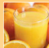
Succhi, concentrati e bevande