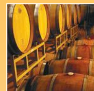
Aziende vinicole, birrifici e distillerie