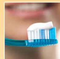
Prodotti per la cura della persona