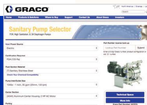
Esempio dello strumento di selezione del prodotto