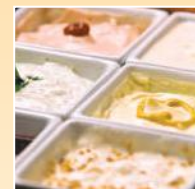
Condimenti e salse